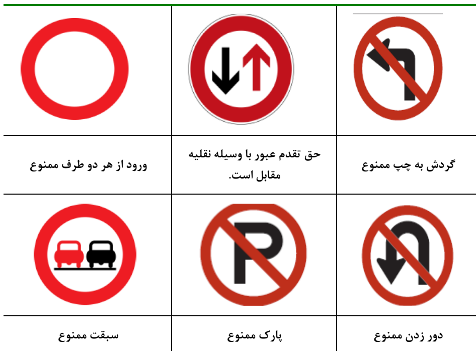
جدول شماره ۱: تابلوهای انتظامی بررسی شده در پژوهش

پرسشنامه پژوهش شامل سه بخش است که بخش اول آن شامل ویژگی‌های شخصی و جمعیت‌شناختی رانندگان است که عبارتند از: جنسیت، سن، وضعیت تاهل، وضعیت شغلی، میزان تحصیلات، سطح درآمد، تجربه رانندگی، میزان تخلفات، سابقه تصادف و میزان خسارت در تصادفات. بخش دوم آن شامل ۹ تابلو ترافیکی (تابلوهای انتظامی) است که در جدول ۱ نشان داده شده است که از رانندگان خواسته شد تا مفهوم هر یک از علائم را بنویسند و برای تحلیل پاسخ‌های درست با کد ۱ و پاسخ‌های نادرست با کد ۰ در نظر گرفته شدند. بخش سوم پرسشنامه شامل سوالاتی در خصوص رفتار رانندگی است که از پرسشنامه رفتار رانندگی منچستر متناسب با تابلوهای بخش دوم پرسشنامه، انتخاب شده است. گزینه‌های پرسشنامه در طیف (۱=هرگز، ۲=خیلی کم، ۳=کم، ۴=برخی اوقات، ۵=زیاد، ۶=تقریباً همیشه) قرار دارد و امتیاز بیشتر نشان‌دهنده رفتار پرخطر رانندگان است.